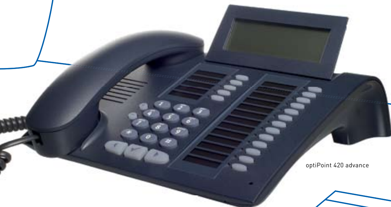
optiPoint 420 advance