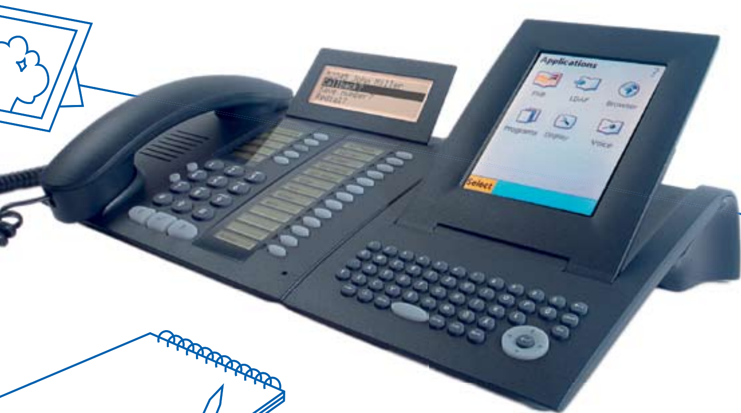
optiPoint 420 advance + модуль приложений optiPoint

Индивидуальные решения, отвечающие всем специальным требованиям