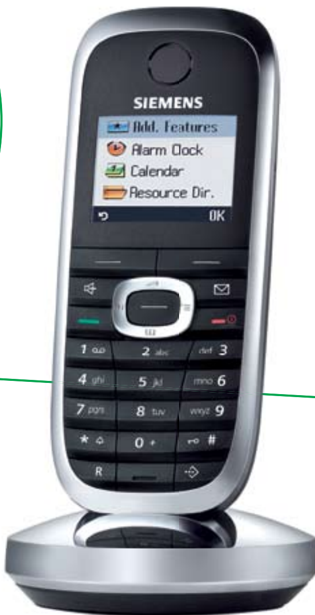
Gigaset SL3 professional